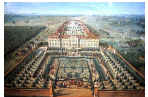
Schloss Halbturn um 1730

Die Besitzer des Schlosses waren Mitglieder des Hauses Habsburg und der Habsburger Kaiser; bis heute ist das Schloss Privateigentum. Kaiser, Feldherren und Diplomaten werden in der Ausstellung lebendig durch Bilder und Objekte illustriert.